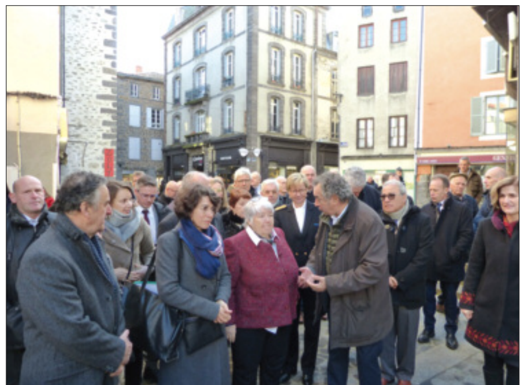
La réhabilitation du centre-ville de Saint-Flour est une des actions que l'ORT va accélérer grâce à un soutien financier important.